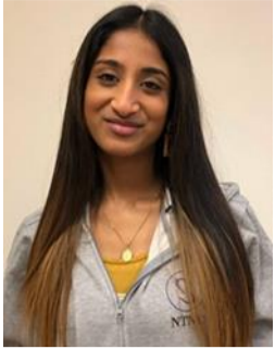
Rajetha Sutha Mandag 10-14 SR-NV-kontoret